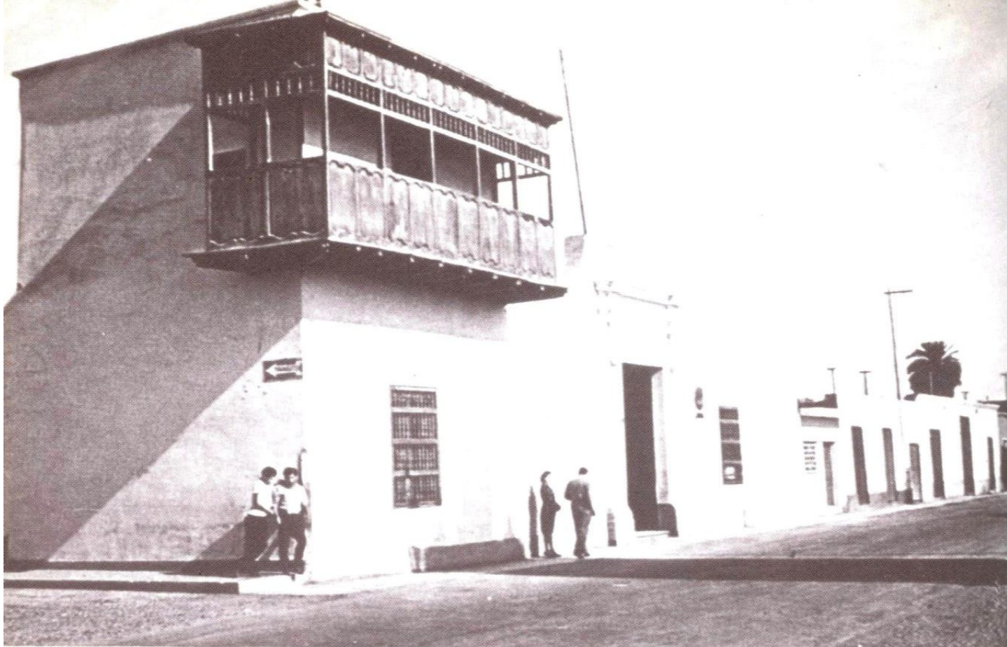
Balcón desde el que San Martín proclamó la independencia del Perú