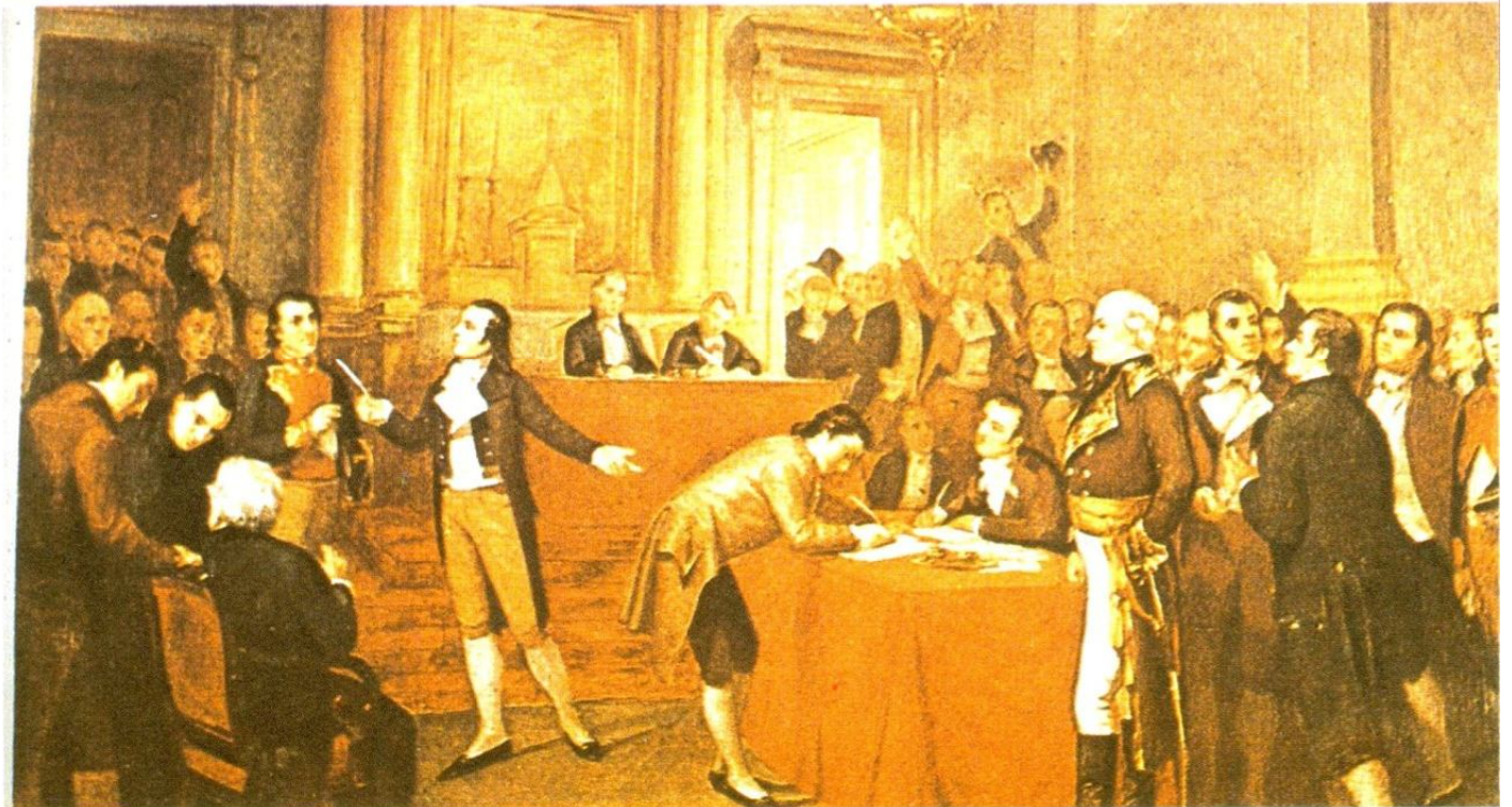
Páez jura como jefe civil y militar de Venezuela (arriba). Firma del Acta de la Independencia de Venezuela, presidida por Miranda, 5 de julio de 1811 (abajo)

ceso de formación de la propiedad en el Orinoco, no quisieron limitarse a la condición de peón. En una región donde la colonización había penetrado mal y sin autoridades que hicieran sentir su poder, se movieron libremente.