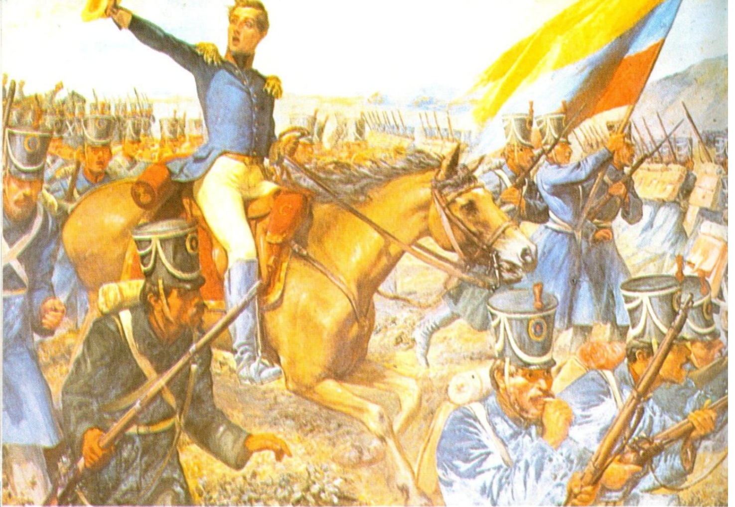
Sucre, en la batalla de Ayacucho (19 de diciembre de 1824)

Venezuela debía establecer una república: sus bases deben ser la soberanía del pueblo; la división de poderes, la libertad civil . Y como el Montesquieu del Espíritu de las Leyes —a quien alude en pasajes de este discurso— inicia una descripción de las formas de gobierno conocidas a través de la historia de la humanidad.