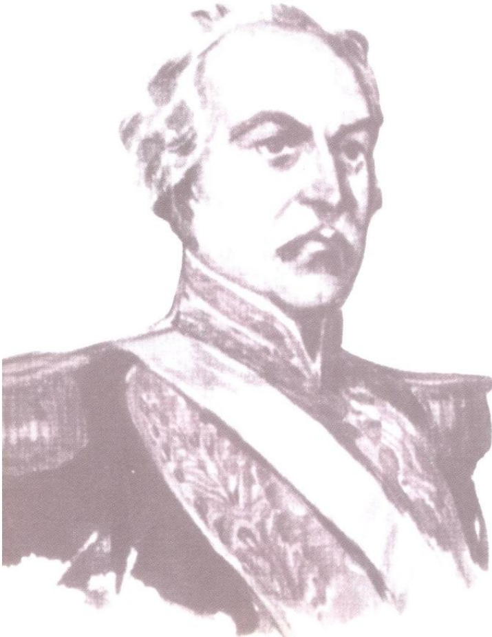
José Antonio Páez

En estas condiciones la campaña militar se hizo penosa. Pero la favorecieron las disensiones entre los jefes españoles, a los que la res-