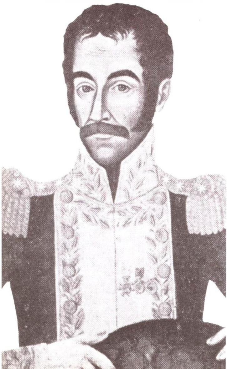
Bolívar poco antes de su muerte (por Pedro José Figueroa)

Bolívar brotaron con igual naturalidad, durante el siglo XIX, los partidos conservadores y liberales, sin que hubiera en ello usurpación indebida de unos ni otros: en Bolívar están la nostalgia estratégica del trono y el recurso táctico del altar usados por los conservadores; y también la invocación al poder del pueblo, el anticlericalismo y la diatriba contra las oligarquías militares y terratenientes, arsenal del radicalismo liberal.