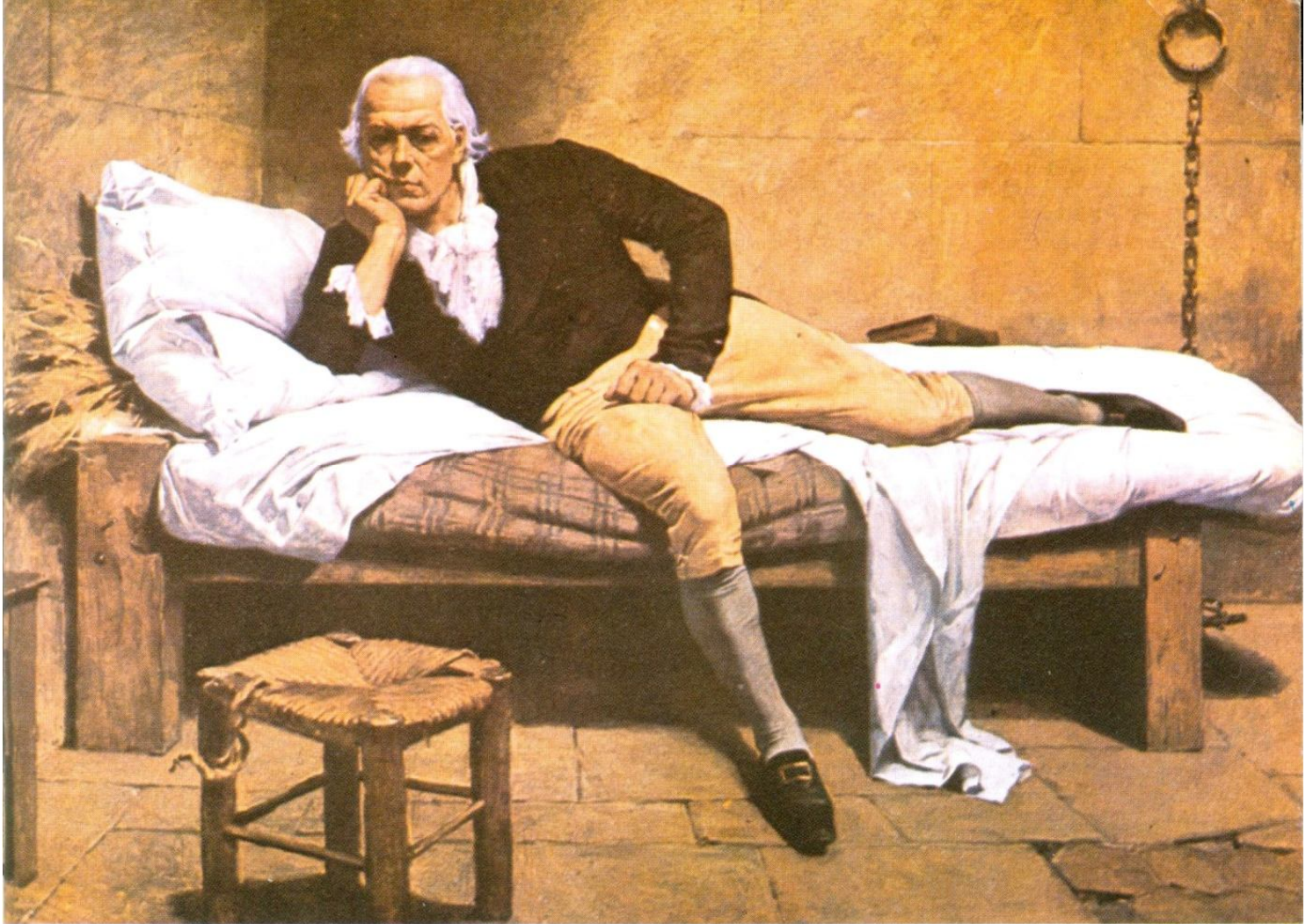
Francisco de Miranda, preso en La Carraca, Cádiz