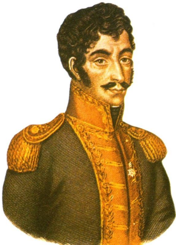
Simón Bolívar (grabado de la Biblioteca Nacional, París)