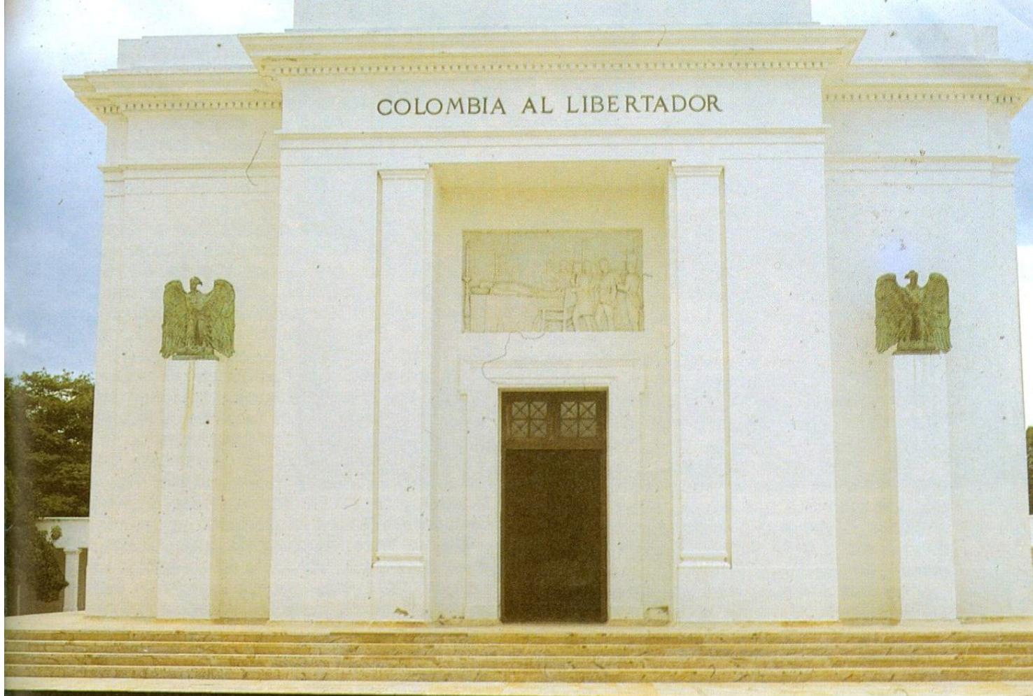
Monumento a Bolívar en la hacienda de San Pedro Alejandrino, Santa Marta (Colombia). Lápida conmemorativa en la catedral de Santa Marta, donde fue enterrado Bolívar. Hacienda de San Pedro Alejandrino, donde Bolívar pasó sus últimos días (abajo, derecha)