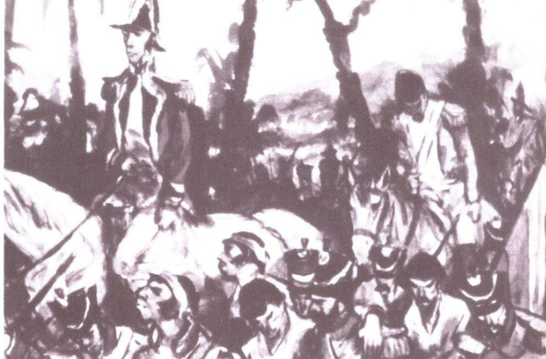
Las tropas de Bolívar derrotadas por Boves

convirtió en poderoso latifundista a expensas de los hombres de su ejército (8).