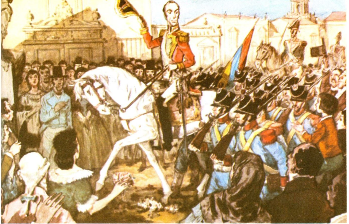
Entrada de Bolívar en Quito (Ecuador)