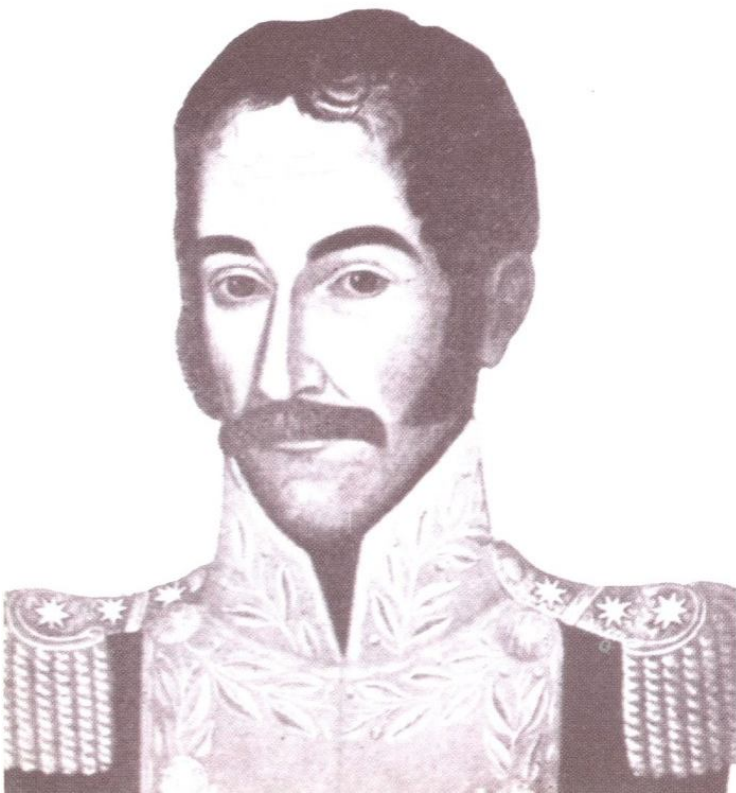
Bolívar (por Pedro José Figueroa, Museo Nacional, Bogotá)

Desde esta posición de fuerza estableció una línea de gobierno enérgica y una política inflexible hacia los españoles. La guerra era terrible y los españoles respondían con la misma crueldad a las acciones de los patriotas, que hacían suya la exhortación de su jefe: Españoles y canarios, contad con la muerte aun siendo indiferentes, si no obráis activamente en obsequio de la libertad de la América. Americanos,