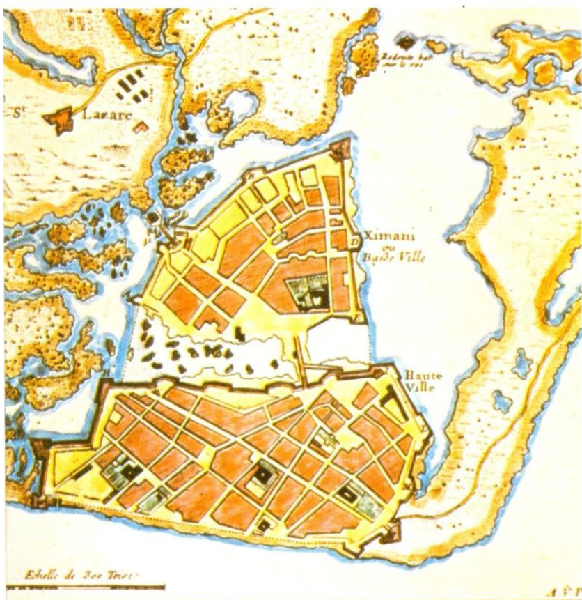
Soldados españoles de ultramar, siglo XIX (arriba). Plano de Cartagena de Indias a mediados del siglo XVIII (izquierda). Retrato de Bolívar en sus últimos días (por Arturo Michelena, Casa del Libertador, Caracas). Bolívar agasajado en Lima (derecha)