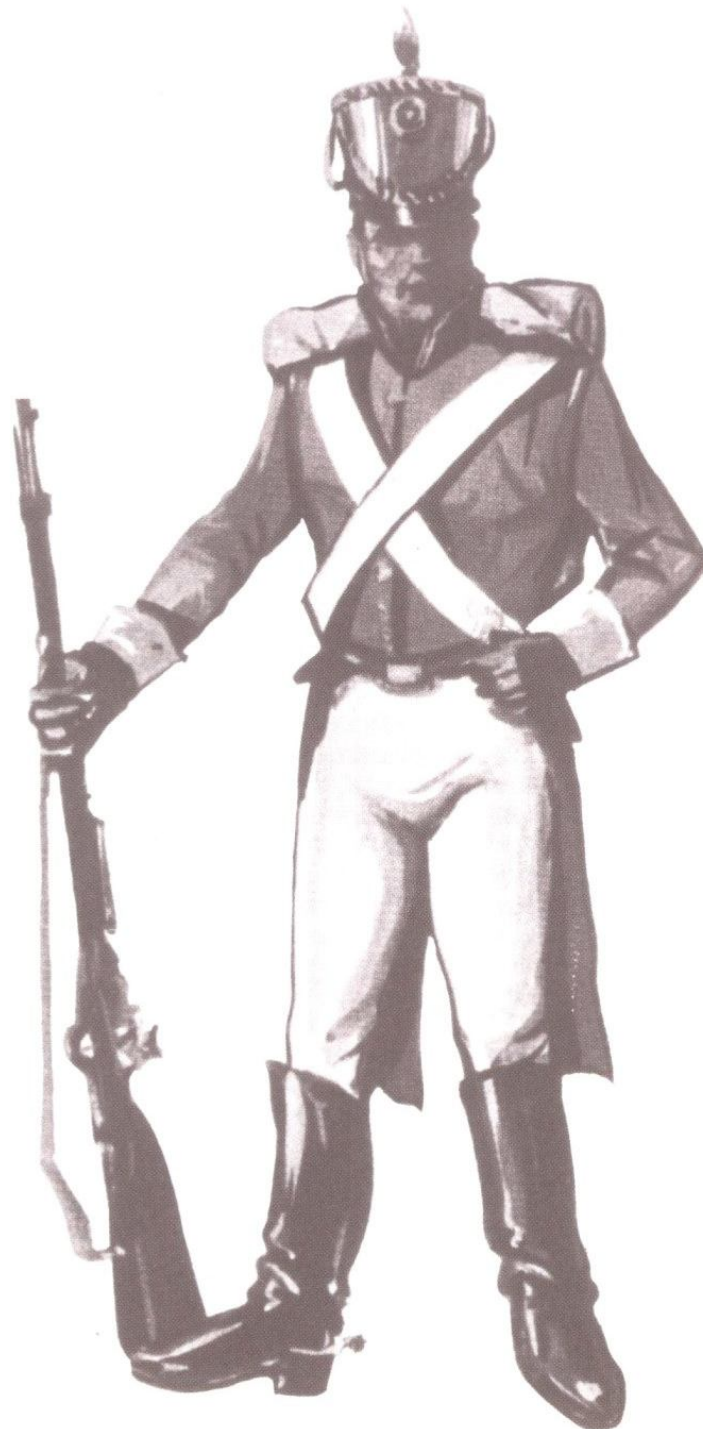
Soldado de infantería del ejército de Sucre

Como los hombres de la Revolución Francesa, el Libertador admiraba la Roma republicana y poseía la pasión de la historia. No dejaba, por tanto, de apoyarse en referencias a instituciones fundamentales de la antigüedad y a la virtud republicana.