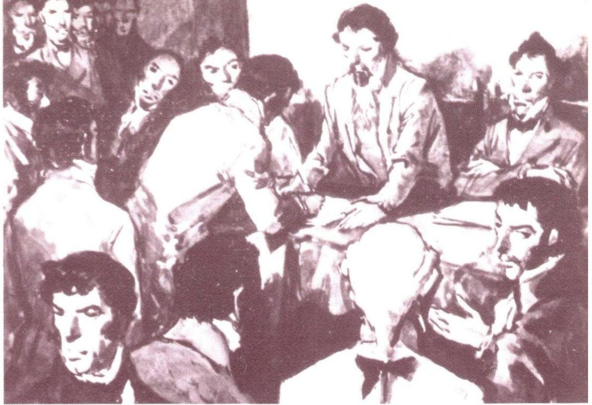
Junta de Caracas (14 de abril de 1810)

cio; el hacendado que no cumpla con esta exigencia será multado con 50 pesos.