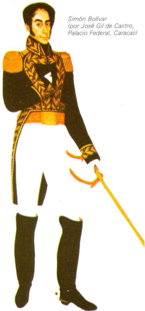
Simón Bolívar (por José Gil de Castro, Palacio Federal, Caracas)