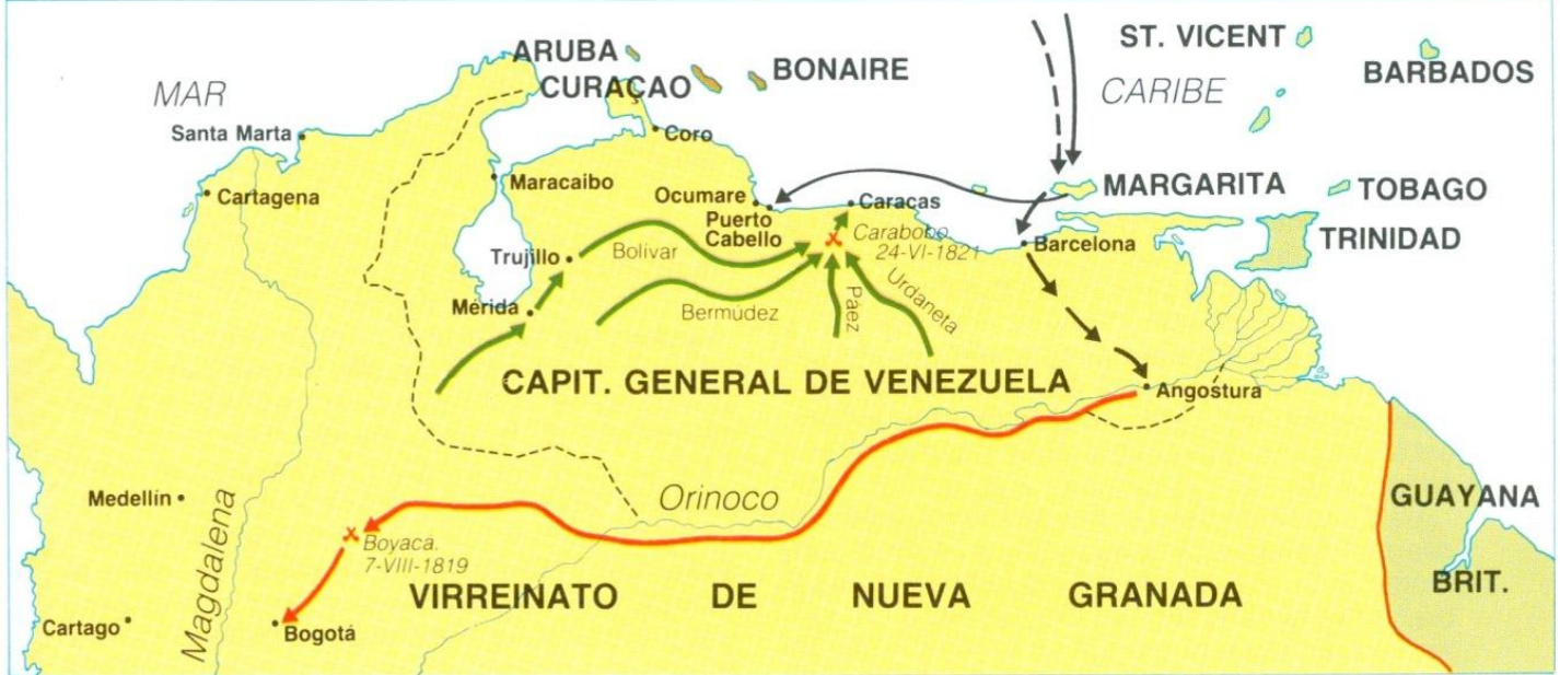
Antonio José de Sucre

vacío, sino como expresión viviente y móvil de una sociedad. El ideario de Bolívar se ve siempre matizado por su conciencia del medio sobre el que deben operar las ideas. De ahí su petición de mayores facultades para el jefe de la República y el predominio del ejecutivo sobre el legislativo. No es este el lugar para tratar de las ideas políticas de Bolívar, para quien el Congreso supuso una victoria, pues reafirmó su posición, y presentó ante el mundo la República como estado independiente y proporcionándole por añadidura sus ideas conservadoras una disminución del rechazo de los países europeos.